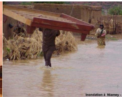
Inondation à Niamey - Août 2000