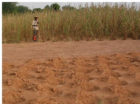
Zaï ou tassa