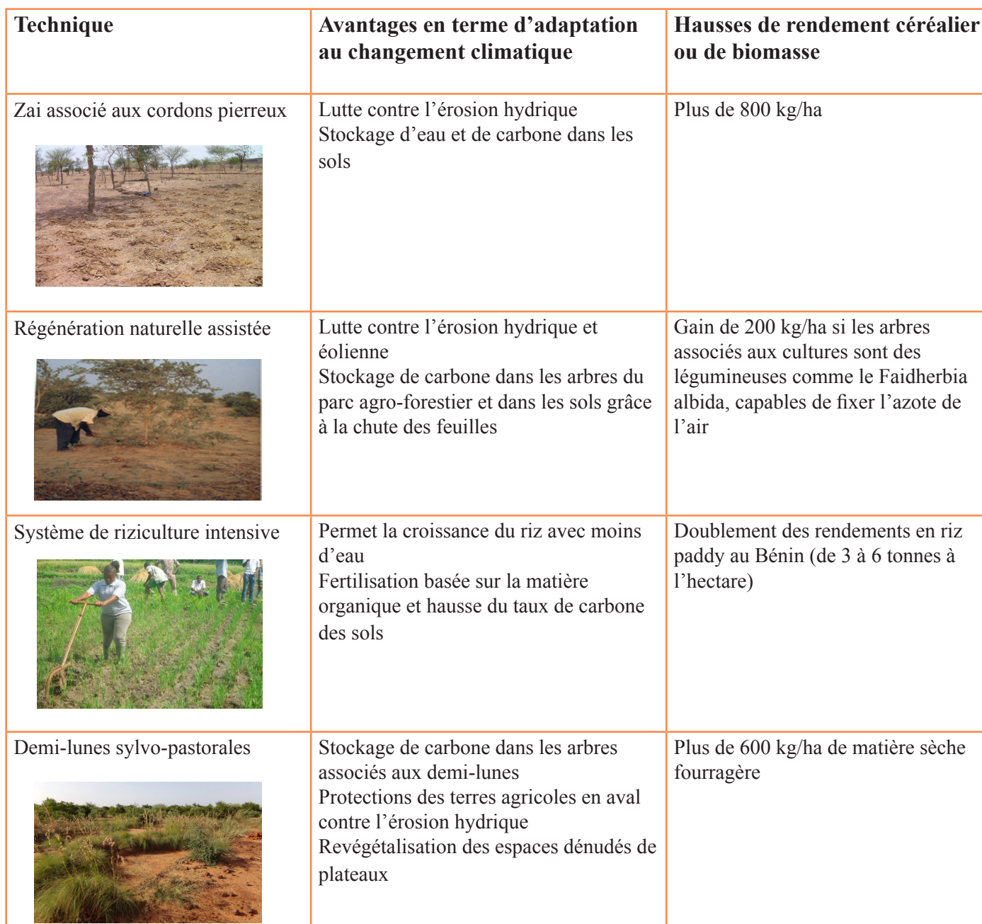
Tableau 3 : Quelques techniques d'agriculture intelligentes face au changement climatique

Suite aux grandes sécheresses des années 70 et 80, les populations ont développé et amélioré de nombreuses techniques performantes. Celles-ci ont fait leur preuve dans l'amortissement des chocs climatiques. Un grand nombre de ces techniques présente des bénéfices liés à l'adaptation, à l'atténuation et à l'amélioration du rendement agricole. Le tableau 3 suivant en présente quelques-unes.