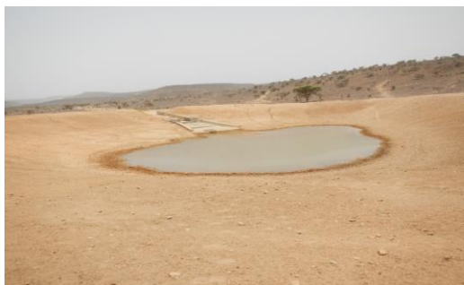
Figure 3 - Abreuvoir à bétail en voie d'assèchement au Burkina-Faso

Enfin, toujours en vertu de l'article II de cette Annexe I, les pays africains Parties arrêtent conjointement les procédures d'élaboration et exécution du Programme d'action régional (PAR-LCD).