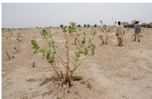
Figure 5 - Paysage semi-aride au Sahel

Les actions de lutte contre la dégradation des terres et la désertification n'ont généralement pas de bénéfices immédiats et directement valorisables économiquement. Cela ne facilite pas une forte mobilisation des financements auprès des groupes pays de l'annexe I et du secteur privé (a contrario de ce qui se produit sous le Protocole de Kyoto, où les privés ont intérêt à générer et échanger des « crédits carbone » issus de projets d'atténuation).