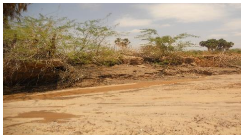
Figure 4 - Erosion de berges (Source : SOS Sahel, 2013)

Au nombre des points forts de la CNULCD, il y a :