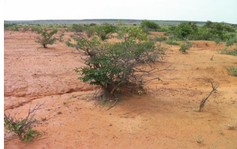
Figure 1 - Glacis dénudé au Niger

Désertification : dégradation des terres dans les zones arides, semi-arides et subhumides sèches par suite de divers facteurs, parmi lesquels les variations climatiques et les activités humaines.