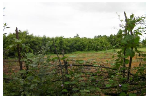
Figure 6 - Haie de neem pour restaurer les sols au Niger

Bien encadré, ce mécanisme pourrait avoir des bénéfices en termes de lutte contre la dégradation et la désertification, de protection de la biodiversité, d'atténuation des / d'adaptation aux changements climatiques et, bien évidemment, en termes de sécurité alimentaire ( ibid ).