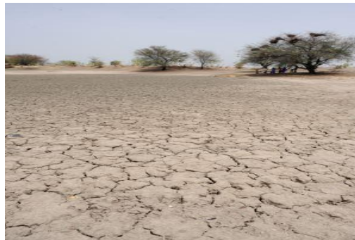
Figure 2 - Cours d'eau asséché au Niger

Sécheresse : phénomène qui se produit lorsque les précipitations sont inférieures aux niveaux normalement enregistrés, ce qui entraîne des déséquilibres hydrologiques préjudiciables aux systèmes de production.