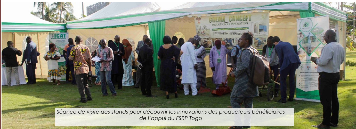
Séance de visite des stands pour découvrir les innovations des producteurs bénéficiaires de l'appui du FSRP Togo

Le Programme de Résilience du Système Alimentaire en Afrique de l'Ouest (FSRP) a tenu sa première réunion de synthèse des missions d'appui pour l'année 2024. L'événement a eu lieu du 15 au 17 mai à Lomé, Togo. Plus 70 participants venus... Lire plus