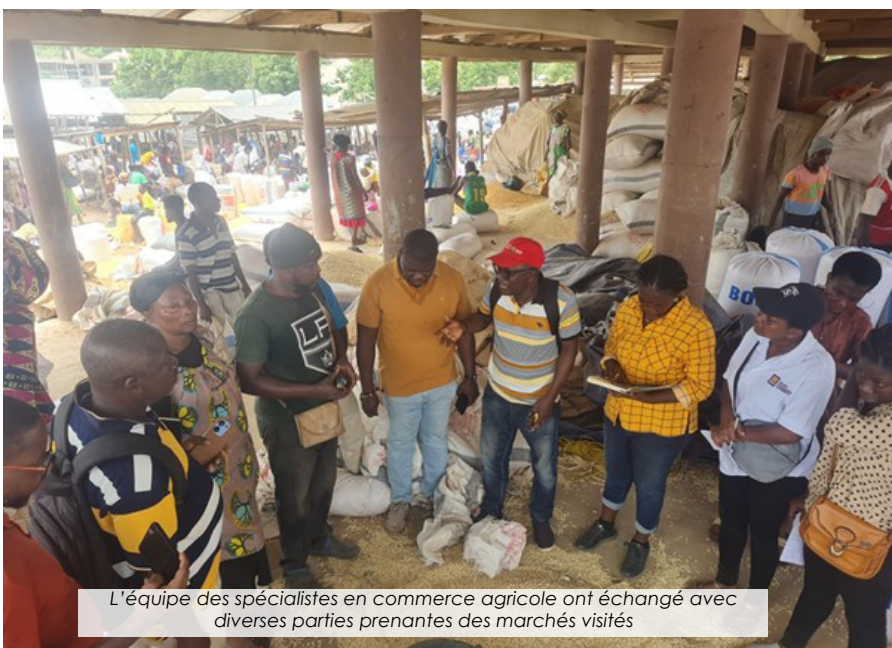
L'équipe des spécialistes en commerce agricole ont échangé avec diverses parties prenantes des marchés visités

Une équipe de spécialistes sur les questions de commerce agricole a visité quatre marchés dans les districts du nord, du centre et du sud du Ghana, afin d'évaluer leur viabilité en tant que centres de commerce transfrontalier de produits agricoles dans la sous-région de l'Afrique de l'Ouest... Lire plus