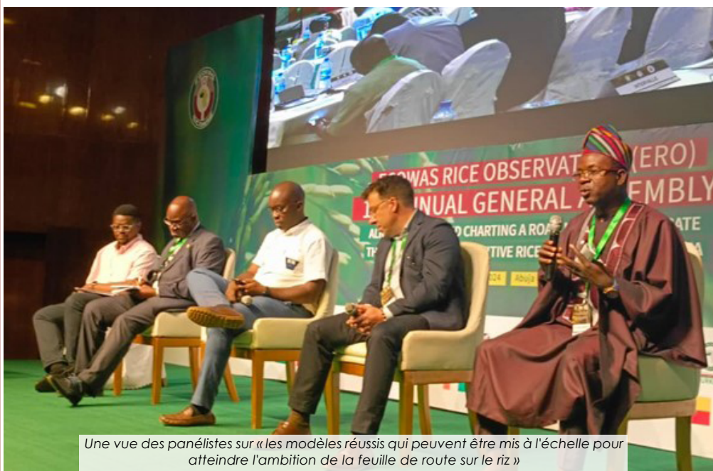
Une vue des panélistes sur « les modèles réussis qui peuvent être mis à l'échelle pour atteindre l'ambition de la feuille de route sur le riz »

Plus de 150 participants issus des Etats de l'Afrique de l'Ouest et leurs partenaires ont pris part à la première Assemblée générale (AG) de l'Observatoire du riz de la Communauté économique des États de l'Afrique de l'Ouest (CEDEAO) tenue les 21 et 22 mai à Abuja, au Nigeria... Lire plus