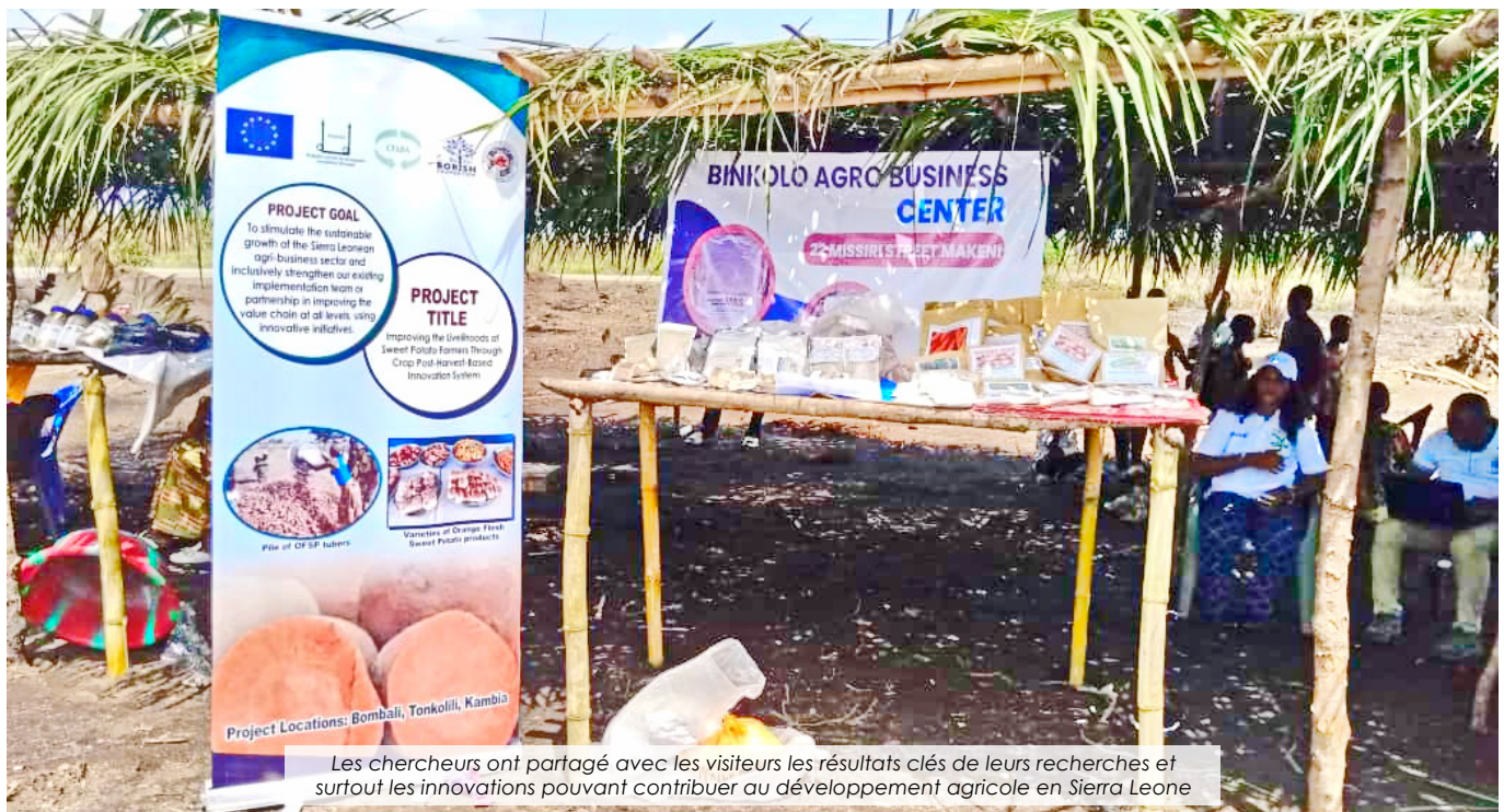
Les chercheurs ont partagé avec les visiteurs les résultats clés de leurs recherches et surtout les innovations pouvant contribuer au développement agricole en Sierra Leone

Le jeudi 9 mai 2024, s'est déroulé dans le village de Komrabai, dans la chefferie de Maforki, dans le district de Port Loko, le lancement officiel du parc de technologie et d'innovation de l'Institut de Recherches Agricoles de Sierra Leone (SLARI) avec l'appui CORAF dans le cadre de la mise en œuvre du programme de résilience du système alimentaire en Afrique de l'Ouest (FSRP).... Lire plus