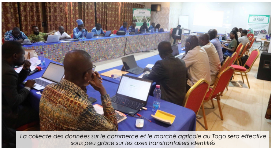
La collecte des données sur le commerce et le marché agricole au Togo sera effective sous peu grâce sur les axes transfrontaliers identifiés

Dans le cadre de la mise en œuvre de la composante 3 du FSRP intitulée « intégration des marchés alimentaires régionaux et le commerce », un tableau de bord du commerce et du marché agricole de la CEDEAO (EATM-Scorecard) a été développé