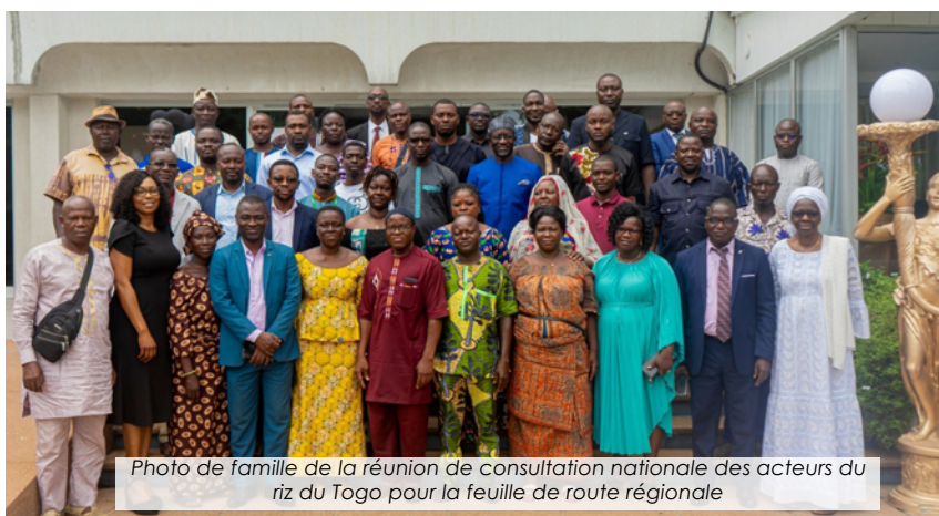
Photo de famille de la réunion de consultation nationale des acteurs du riz du Togo pour la feuille de route régionale