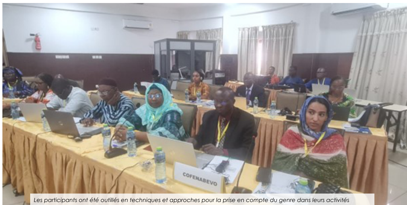
Les participants ont été outillés en techniques et approches pour la prise en compte du genre dans leurs activités

La coordination régionale du Programme de résilience du système alimentaire de l'Afrique de l'Ouest (FSRP) a organisé du 07 au 09 mai 2024 à Accra au Ghana, un atelier de formation sur le genre destiné aux interprofessions des chaînes de valeur agroalimentaires régionales.