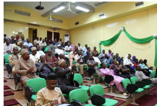
Vue des participants

Toutes ces qualités ont été auréolées par une promotion qui s'est traduite par son recrutement en qualité d'assistant technique de l'Union Européenne dans un projet sur les changements climatiques basé à Ndjamená.