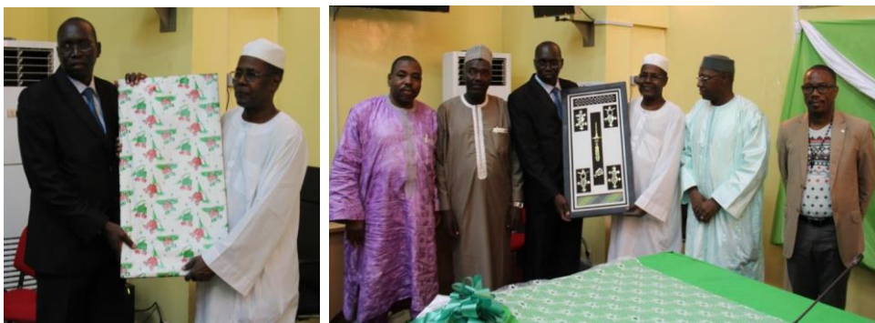
Remise d'un cadeau par le Secrétaire Exécutif

...un cocktail a été servi à la fin de la cérémonie