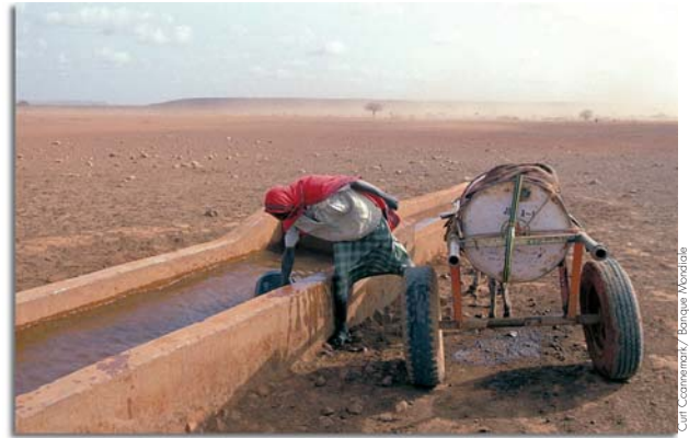
Suite aux grandes sécheresses des années 70, les Sahéliens ont développé des techniques de stockage des eaux pluviales.

Aucune synthèse détaillée n'existe à notre connaissance sur les pratiques d'adaptation qui seraient déclinées selon différents contextes, ni sur leur pertinence et leurs potentiels au regard des récentes évolutions économiques et climatiques (mondialisation). De plus, si la vulnérabilité fait l'objet d'études scientifiques dans les disciplines écologiques et en sciences sociales, il manque une réflexion associant les deux types de vulnérabilité 10 et les croisant avec des modes d'adaptation déterminés.