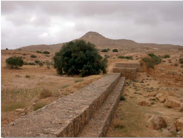
L'aménagement de cordons en pierres sèches est un exemple des pratiques instaurées pour lutter contre l'érosion des sols.

La dernière Conférence des Parties de l'UNFCCC (Nairobi, novembre 2006) a reconnu que les effets du changement climatique seront ressentis de manière disproportionnée dans les pays en développement, plus vulnérables, incapables de réduire ces effets et risquant de perdre certains acquis générés par le développement actuel : dans ce cadre, le SBTA (Subsidiary Body for Scientific and Technological Advice) a reconduit pour deux ans le programme de travail sur les impacts, la vulnérabilité et l'adaptation au changement climatique. Il devra notamment produire des informations sur les risques climatiques et d'autres socio-économiques sur des pratiques et des plans d'adaptation, ainsi que proposer des technologies pour l'adaptation et des modes de diversification économique.