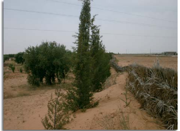
Pour lutter contre l'ensablement, on érige des barrières et on plante des arbres.

L'UNCCD ne dispose pas d'outil de financement 14 . La LCD et la mise en œuvre des PAN sont donc soumis principalement au bon vouloir de la coopération bilatérale, en dehors de quelques fenêtres réduites en multilatéral, principalement la fenêtre land degradation du FEM qui est actuellement en réforme.