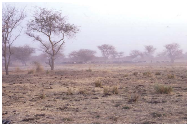
La sécheresse empêche la croissance normale des récoltes, et brûle même les pousses sur pied.